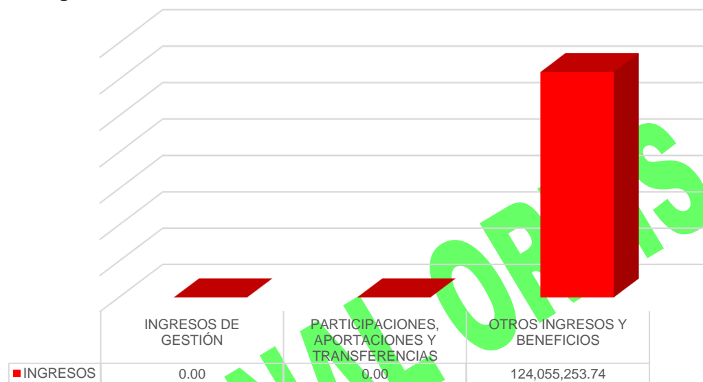
Gráfico 1. Ingresos